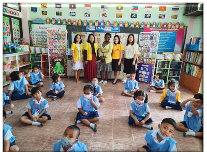
นิเทศ กำกับ ติดตาม การจัดกิจกรรมอย่างสม่ำเสมอ(Check)