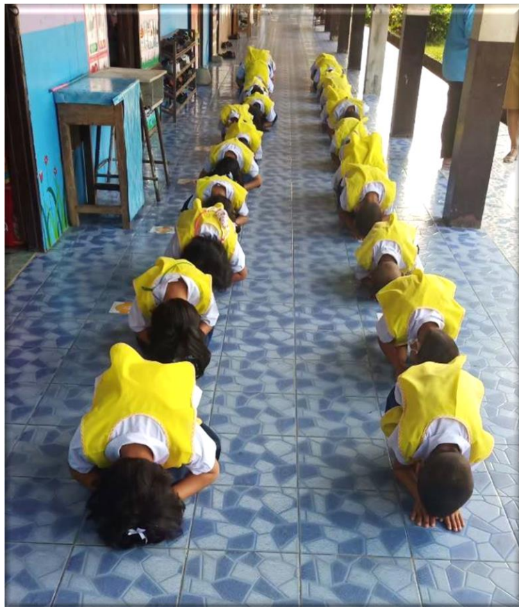
กิจกรรมการฝึกปฏิบัติในชั้นเรียน สายชั้นอนุบาล ๓ (Do)