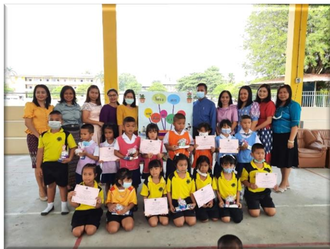
สรุป ประเมินผลการดำเนินกิจกรรม ยกย่อง ชมเชยให้กำลังใจ