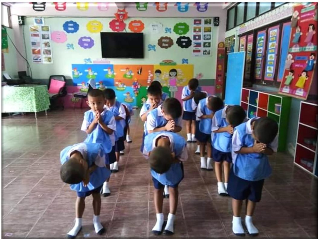
กิจกรรมการฝึกปฏิบัติในชั้นเรียน สายชั้นอนุบาล ๒ (Do)