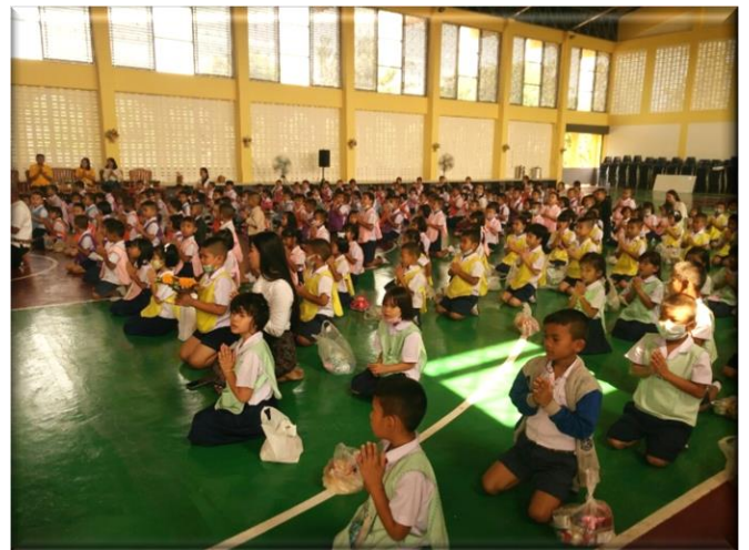
ฝึกปฏิบัตินอกห้องเรียนในสถานการณ์จริง (Do)